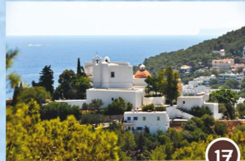
Iglesia del Puig de Missa

Desde este punto hay una excelente panorámica: el Puig de Missa, con su iglesia fortificada del siglo XVI, el Centro de Interpretación del Río - Can Planetes (Molí de Dalt) , las acequias, las huertas, los molinos, el Puente Nuevo, el Puente Viejo, el río, etc. y en el fondo, el paseo marítimo, la playa junto al río y el mar.