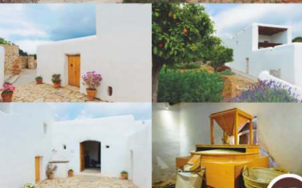
Molí de Dalt (molino) Centro de Interpretación del Río Can Planetes

El molino de Can Planetes o 'Molí de Dalt' es hoy Centro de Interpretación del Río. Es una casa tradicional que incluye un molino de agua, que es probablemente de origen andalusí (siglo X), y que estuvo funcionando hasta el siglo XVIII antes de ser reemplazado por otro con una rueda vertical que dejó de trabajar en 1960.