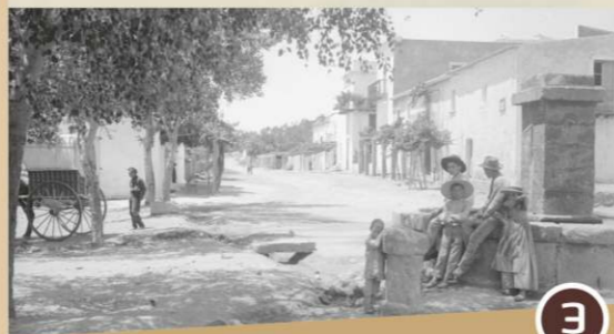
Es Broll i Pou de Baix (surtidor y pozo)

Las aguas se canalizaban desde el río para proporcionar agua de riego al pueblo.