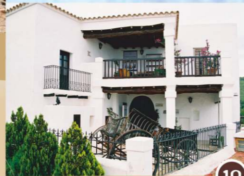
Museo de Etnografía de Ibiza

Durante más de 500 años, los habitantes de una gran parte de la isla iban a misa a la iglesia del Puig de Missa; llegaban a pie o en carro por los diferentes Camins de Missa , caminos que conducen al Puig.