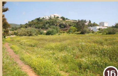
Camins de Missa - Camí des Novells (caminos)