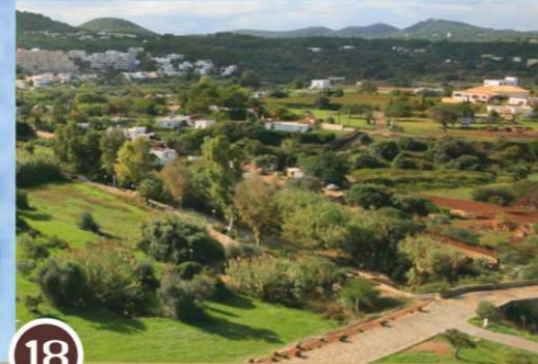
El río desde el Puig de Missa

Durante el siglo XV el pueblo de Santa Eulària se fue formando alrededor de la iglesia, que fue fortificada más tarde, situada en el montículo desde donde presidía unas cuantas casas diseminadas en los campos y el río.