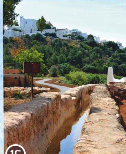
Sèquia des Mallorquí (acequia)

Para ampliar la superficie de regadío a la parte alta del pueblo, en la década de 1920 se construyó un ramal del canal principal: el Canal des Molins que se llamó la Sèquia des Mallorquí (acequia) , pero cayó en desuso cuando el turismo comenzó a desarrollarse en la localidad.