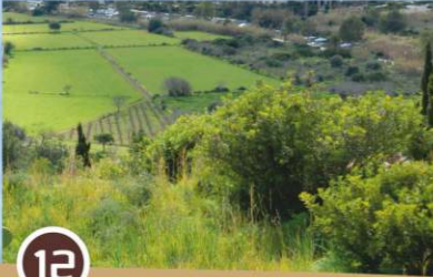
Huerta de Santa Eulària

El agua se desviaba del río a través de tres canales de riego principales situados entre el río y la pequeña colina, sobre la que se construyó la iglesia fortificada. El mayor de ellos es el Canal des Molins que fue diseñado en la época andalusí (siglo X). El agua también impulsaba los molinos de harina de la zona.