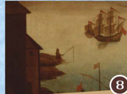
Molí de Baix (molino)

A 1 kilómetro del río, y un poco más arriba de la Font des lerns (fuente), nace el Torrent des lerns, que es uno de los más importantes que desemboca en el río de Santa Eulària. Sus aguas se utilizaron durante muchas décadas para el riego de multitud de huertos que se encuentran en las laderas.