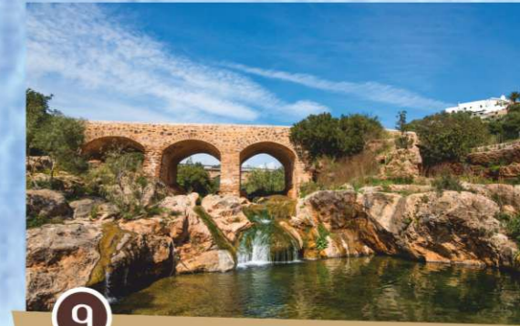
Pont Vell y Font d'en Lluna (puente y fuente)

La leyenda cuenta que el diablo tomó parte en las obras de este puente que se construyó, supuestamente, antes del siglo XVIII.