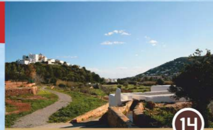
Mirador del río