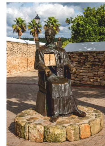
Escultura del Obispo Abad y Lasierra

Las obras del templo se alargaron hasta el año 1797, habiéndose añadido diversos elementos desde entonces, como una capilla lateral que le da a la nave un aspecto de L o el propio campanario, construido en 1899. Cuando visites la iglesia de Santa Gertrudis, pon atención al retablo original de madera de finales del siglo XVIII y al porche, atípico por su pequeño tamaño y por ser el único de la isla que se encuentra a la misma altura que la fachada. El templo debe su denominación a la advocación de Santa Gertrudis de Helfta (Eisleben, Alemania, 1256 - Helfta, 1302), una monja benedictina cisterciense y escritora mística, también conocida como Gertrudis la Grande o Gertrudis Magna.