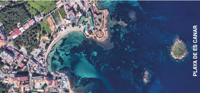
PLAYA DE ES CANAR

Ser respetuoso con la playa significa respetar el medio ambiente. Nuestras conductas deben ser responsables de manera que podamos disfrutar de este entorno natural y seguro durante mucho tiempo.