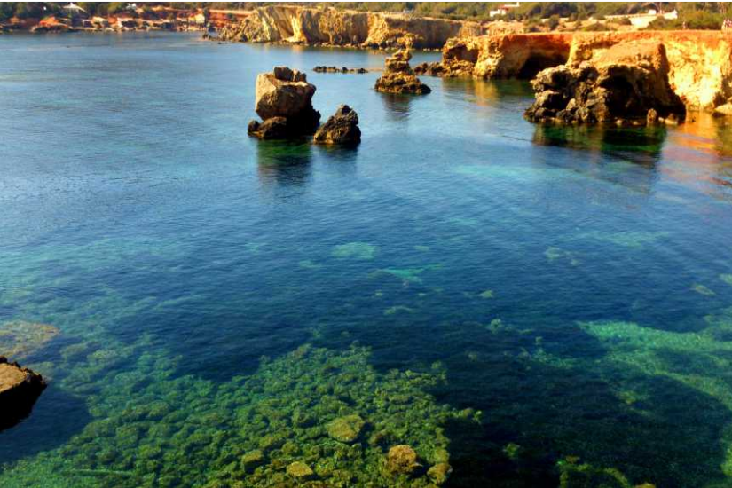
Canal d'en Martí