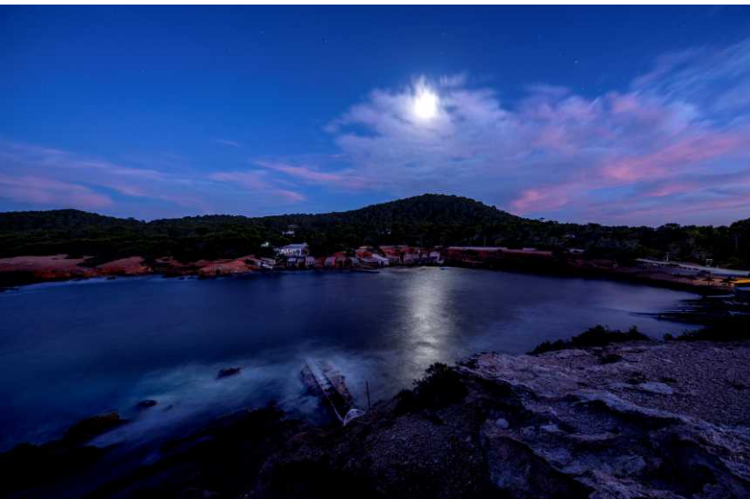
Canal d'en Martí

RUTA ES POU DES LLEÓ-CANAL D'EN MARTÍ ES POU DES LLEÓ-CANAL D'EN MARTÍ ROUTE