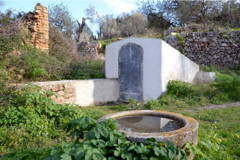
Font d'Atzaró (fuente / fountain)