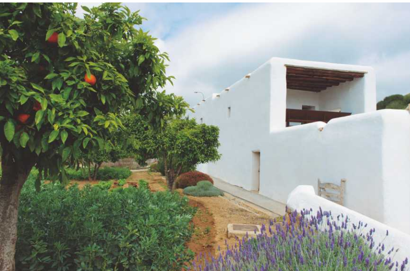
Iglesia del Puig de Missa / Church of Puig de Missa