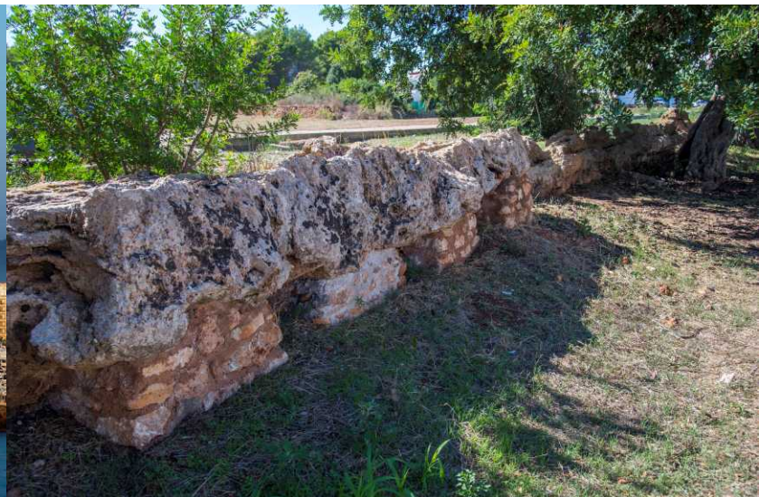
Acueducto romano de S'Argamassa / Roman aqueduct of s'Argamassa