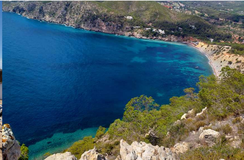
Salt d'en Serrà