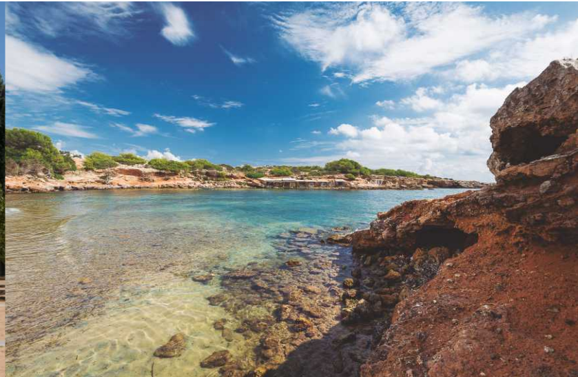
Playa de S'Estanyol / S'Estanyol beach