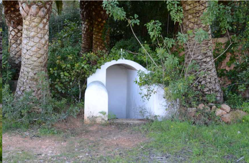
Font de Perella (fuente / fountain)