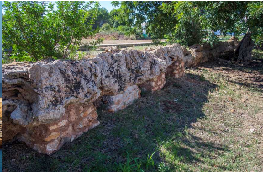
Acueducto romano de S'Argamassa / Roman aqueduct of s'Argamassa