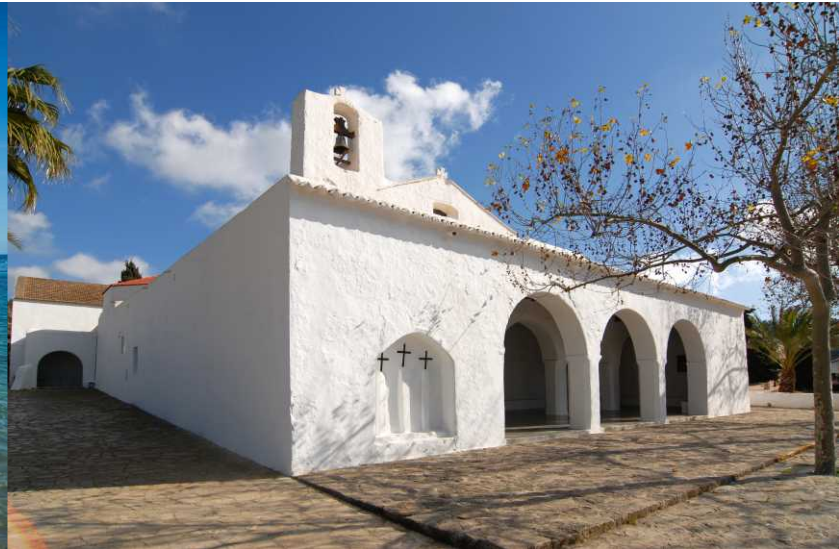
Iglesia de Sant Carles / Church of Sant Carles