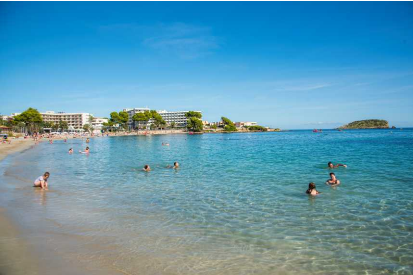
Playa de Es Canar / Es Canar beach