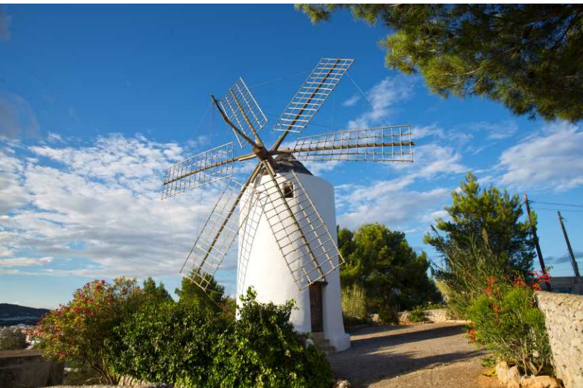
Molino harinero de Es Puig d'en Valls / Mill of Es Puig d'en Valls

RUTA ES PUIG D'EN VALLS ES PUIG D'EN VALLS ROUTE