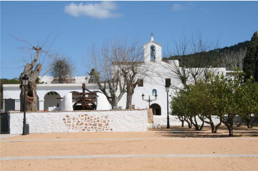
Iglesia de Jesús / Church of Jesús