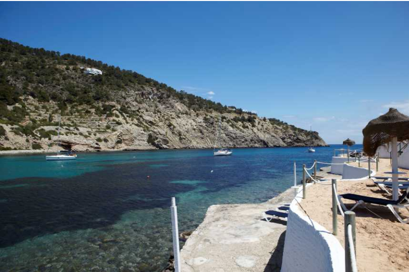
Cala Llonga / Cala Llonga beach

RUTA DE CALA LLONGA A CAP DES LLIBRELL CALA LLONGA TO CAP DES LLIBRELL ROUTE